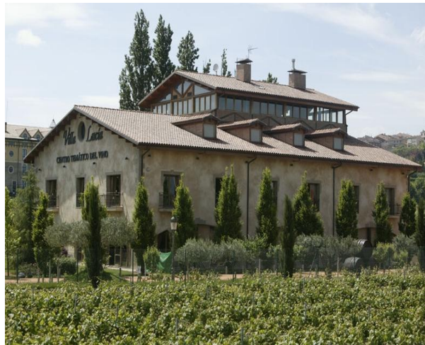
Centro de Interpretación