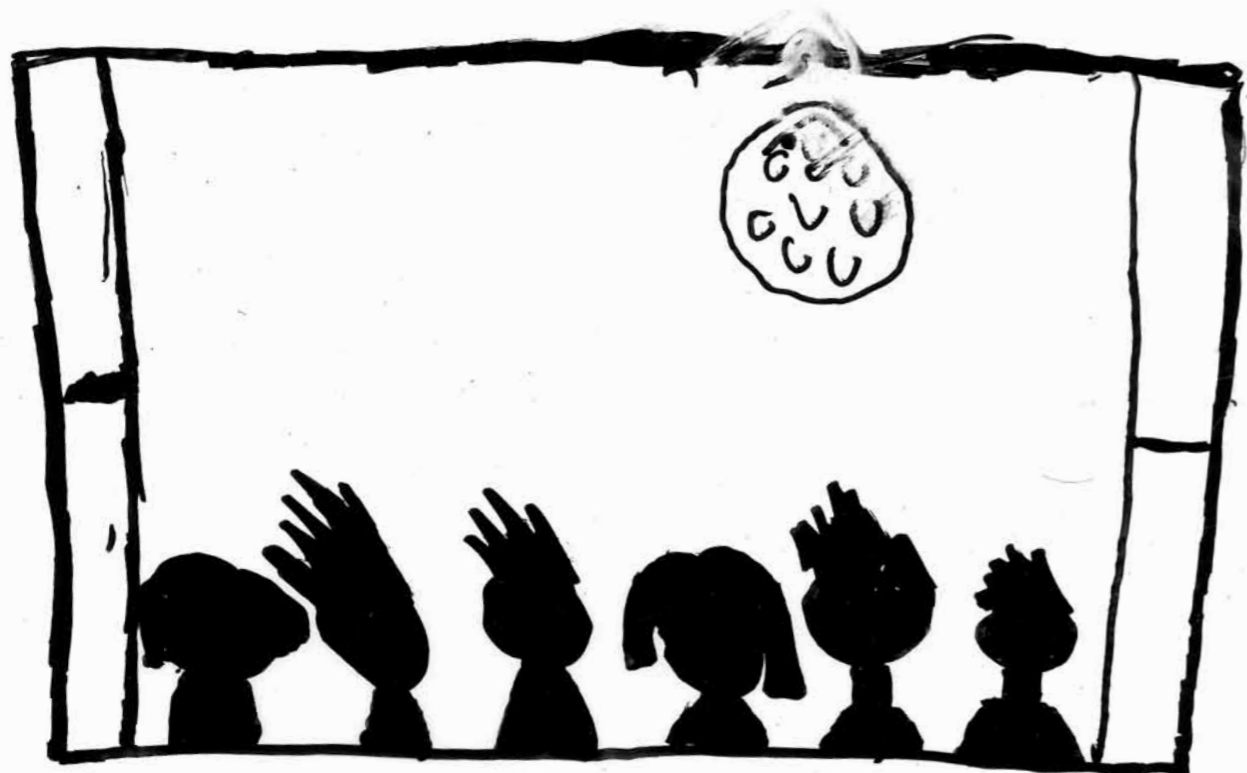
Desenho de aluno da EB1 de Arneirós, Vila Real no âmbito do Espaço – Projecto com escolas 2008/2009

Esta desmontagem dos estereótipos não é, de todo, rápida e nem sequer é consensual este desejo de alteração. No nosso caso, passa por mostrar e fazer com mais variedade, com mais diversidade de oferta e com conteúdos e práticas que, de outro modo, crianças, jovens, professores não teriam acesso, seja por questões geográficas, geracionais ou pelos contextos mais ou menos conservadores ou ortodoxos (que não cabe aqui julgar) dos processos de aprendizagem, seja na escola ou na família.