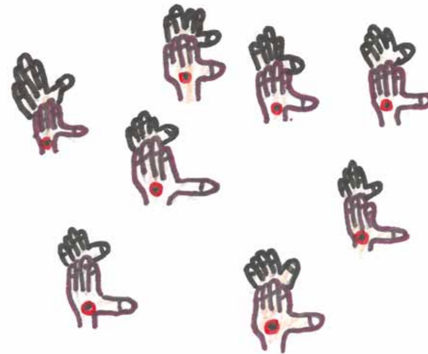
Desenho de aluno de EB1 da S. Cibrão no âmbito do 'O Espaço' - Projecto com escolas 2008/2009