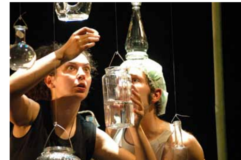
Kabrrumm, espectáculo - encomenda para o 'Água 2007 E 2008' Projecto com Escolas

Habitar /habitar por excesso /habitar por defeito/ver aquilo que é habitado /mostrar que isso é habitado / ver o tempo habitar o espaço/ ver o tempo abandonar o espaço /