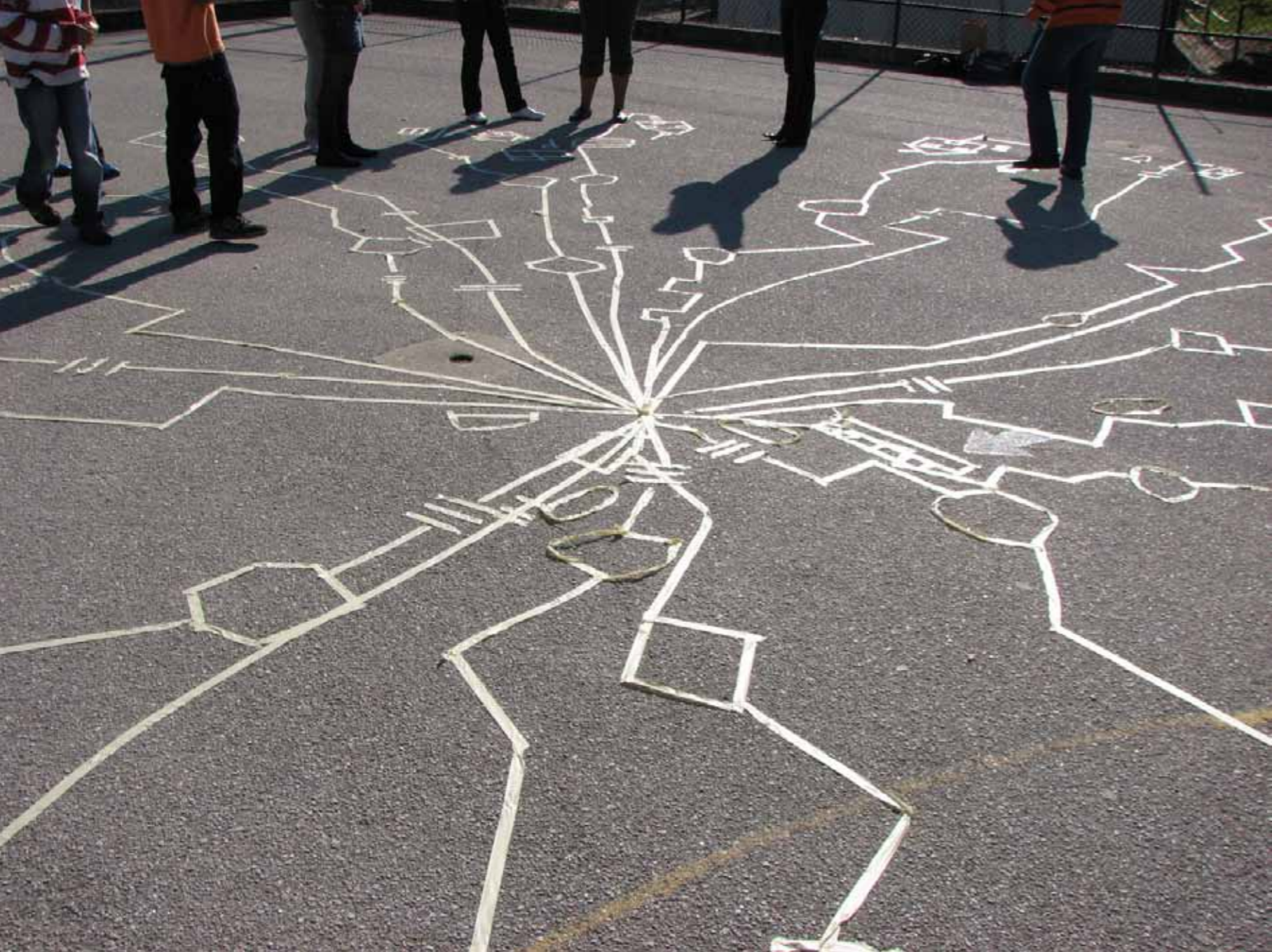
Mapa Percurso – Intervenção nas escolas no âmbito do Água' 2007 E 2008' Projecto com Escolas

(...) É preciso dançar nos prados /Enquanto há prados... (...). Ver é decifrar. Olhar é construir. Só se mostra o que se vê quando se olha. Se a criação não enfrentar o atrito, será tão só recreio. (Regina Guimarães, Cartas a AC, Porto: Cadernos do Rivoli, 2004 , p.7 e 10).